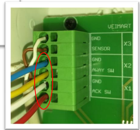
Kuva 2. KLM 4x0.8:n johtimien kytkentä VMEX-10 -laajennusyksiköllä.

Huom. Kuvassa olevaan laajennusyksikköön on kytketty tässä tapauksessa myös teipianturi VMLS-10 (ylimpänä näkyvät valkoinen ja ruskea X3-liittimissä).